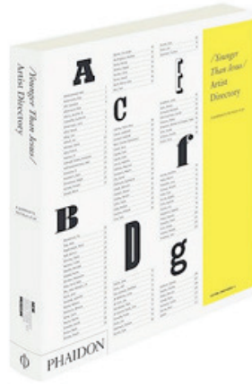
Younger than Jesus. Artist Directory. The essential handbook to the future of art New Museum, New York: Phaidon, 2009. p. 392.