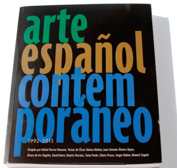
Arte Español Contemporáneo 1992-2013 Madrid: La Fábrica, 2013. pp. 114-115 y pp. 208-209.